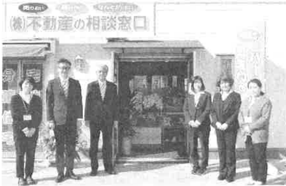
移転オープンした「不動産の相談窓口」